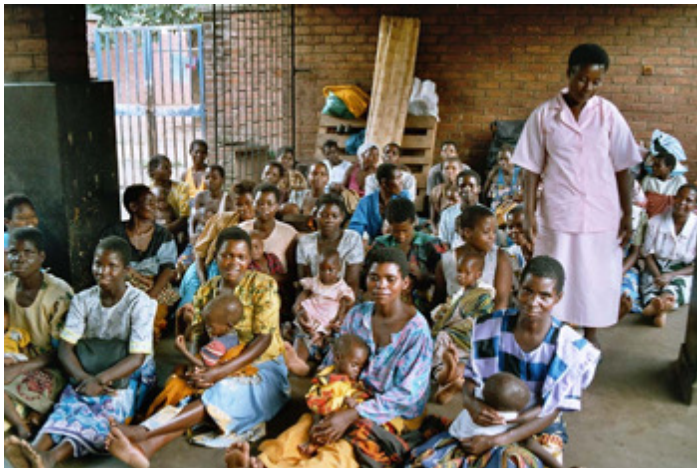
Abb. 3: Ernährungsberatung und Kochkurs für die Mütter auf der Unterernährten-Station am Zomba Hospital, Malawi

Dabei haben die Länder längst Programme für den Aufbau bzw. die Verbesserung einer chirurgischen Basisversorgung entwickelt. Nicht nur wegen der ökonomischen und infrastrukturellen Probleme gestaltet sich deren Realisierung aber schwierig; andere Probleme sind kultureller Natur oder auf das starke Traditionsbewusstsein der Menschen zurückzuführen. Programme, die eine Verbesserung der chirurgischen Versorgung zum Ziel haben, müssen dies berücksichtigen.