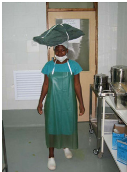
Abb. 1 A und B: Chirurgie unter Akzeptanz der afrikanischen Bedingungen