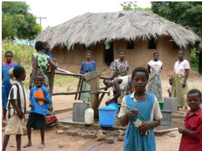
Abb. 4: Dorfleben in Malawi – Der Brunnen als Quelle von Wasser und Informationen

menschlicher und volkswirtschaftlicher Bedeutung. Dies betrifft vor allem die unfallbedingten und onkologischen Erkrankungen. Dabei lässt sich die Inzidenz dieser Krankheitsbilder und ihrer Folgen durch gezielte Präventionsprogramme oft billiger und effizienter zurückdrängen. Deren Etablierung bedeutet aber einen kräftezehrenden Gang durch verschiedenste medizinische und politische Institutionen – mit ungewissem Ausgang. Seit dem vorletzten Jahr hat die WHO zusammen mit den Entwicklungsländern ein solches Projekt gestartet: die Global Initiative for Emergency and Essential Surgical Care (GIEESC). Lesen Sie hierzu den Beitrag von Matthias Richter-Turtur in diesem Heft.