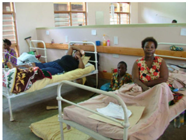
Abb. 2a: Die chirurgische Frauenstation am Zomba Central Hospital in Malawi – hohe Bettenauslastung ohne Murren.

Durch den Prozess der „epidemiologischen Transition“, also die veränderten Lebensbedingungen und das Zurückdrängen der Infektionen als Hauptursache der weltweiten Mortalität, klettern die chirurgischen Erkrankungen gerade in die Top ten – Listen der Mortalitätsstatistiken. Dies betrifft vor allem die Verletzungen und onkologischen Erkrankungen. Durch Unfälle verlieren jährlich mehr als 5 Millionen Menschen ihr Leben; das ist fast jeder zehnte Tote weltweit. 500.000 Mütter sterben im Verlauf einer komplizierten Schwangerschaft, deren Leben durch eine adäquate gynäkologisch-operative Behandlung hätte gerettet werden können.